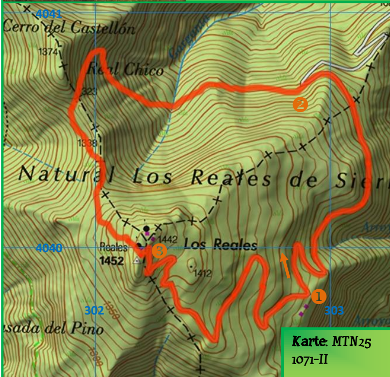
Karte: MTN25 1071-II