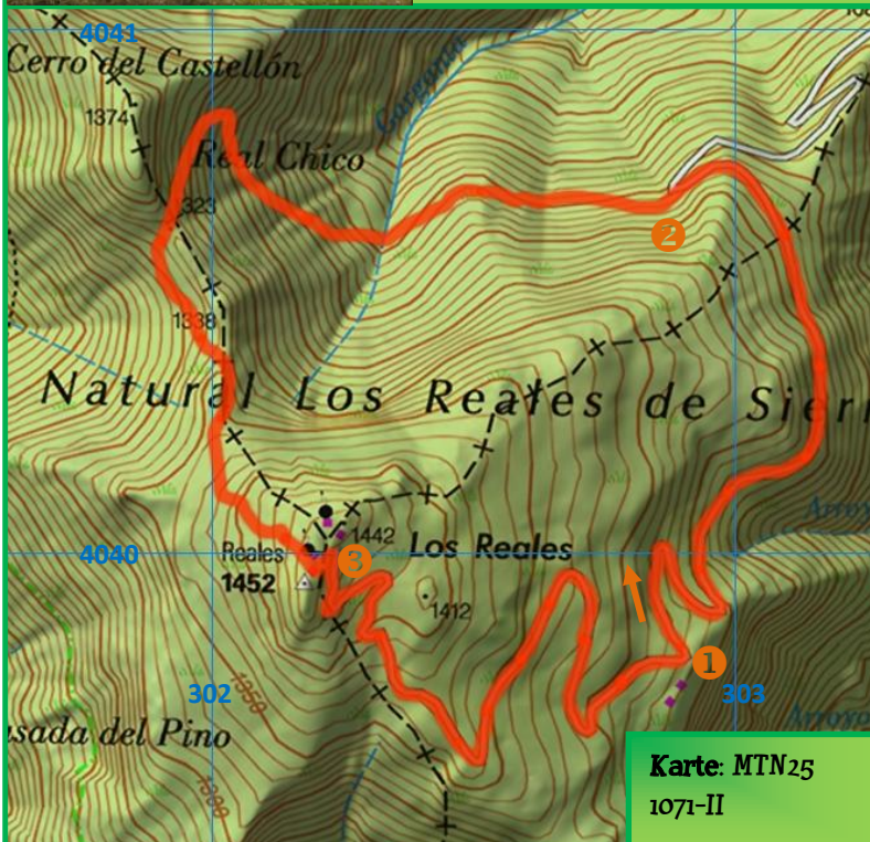
Karte: MTN25 1071-II