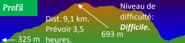
Base cartográfica © Instituto Geográfico Nacional de España

L'itinéraire est aussi traité par la Carte Ornithologique de la région, de BioGea.